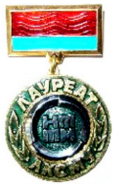
Лауреат премії ЦК ЛКСМУ

Відкриті невідомі раніше біофізичні феномени і виявлені помилки Східної Чжень-цзю терапії (ЧЦТ, акупунктури, голктерапії) дозволили розробити сучасне бачення вегетативної сутності традиційного напрямку. Сьогодні настав час запропонувати до уваги медичних фахівців завершену науково обгрунтовану концепцію сучасної "Функціональної вегетології – вегетативної Чжен-цзю терапії".