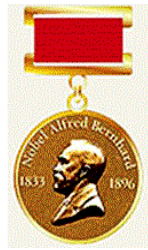
Медаль Альфреда Нобеля