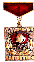
Лауреат премії ЦК ВЛКСМ