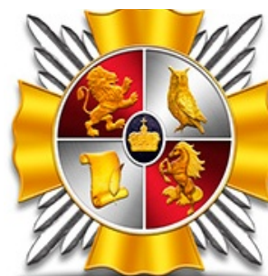
Орден Primus inter pares