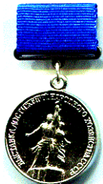
Медаль ВДНГ СРСР