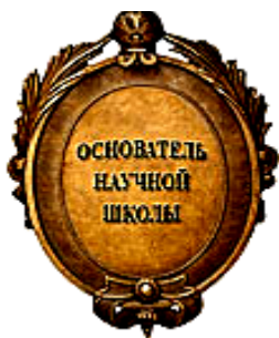
Засновник наукової школи (РФ)

Європейським науково-виробничим консорціумом, Українською, Європейською та Російською Академіями Природознавства розроблені напрямки визнані науковою школою проф. В.Г.Макаца (Україна, Вінниця) і відмічені науковими нагородами за вагомий внесок в розвиток світової науки. Інформація увійшла до енциклопедій "Російські наукові школи", "Видатні учені Росії" та автобіографічний збірник "Академія технологічних наук України" (1991-2006).