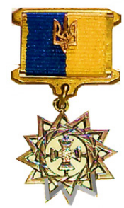
Орден Harmony of Life