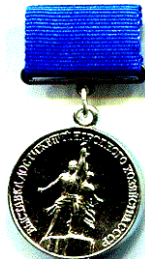
Медаль ВДНГ УРСР